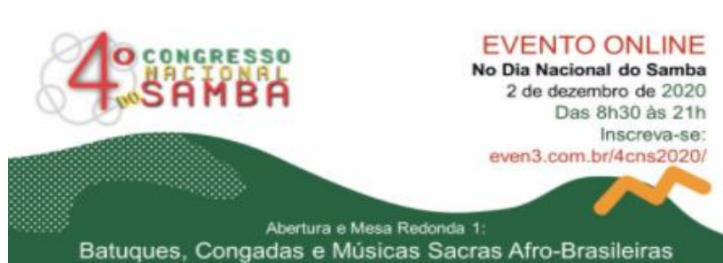
Figura 1: Título da figura

Legenda.